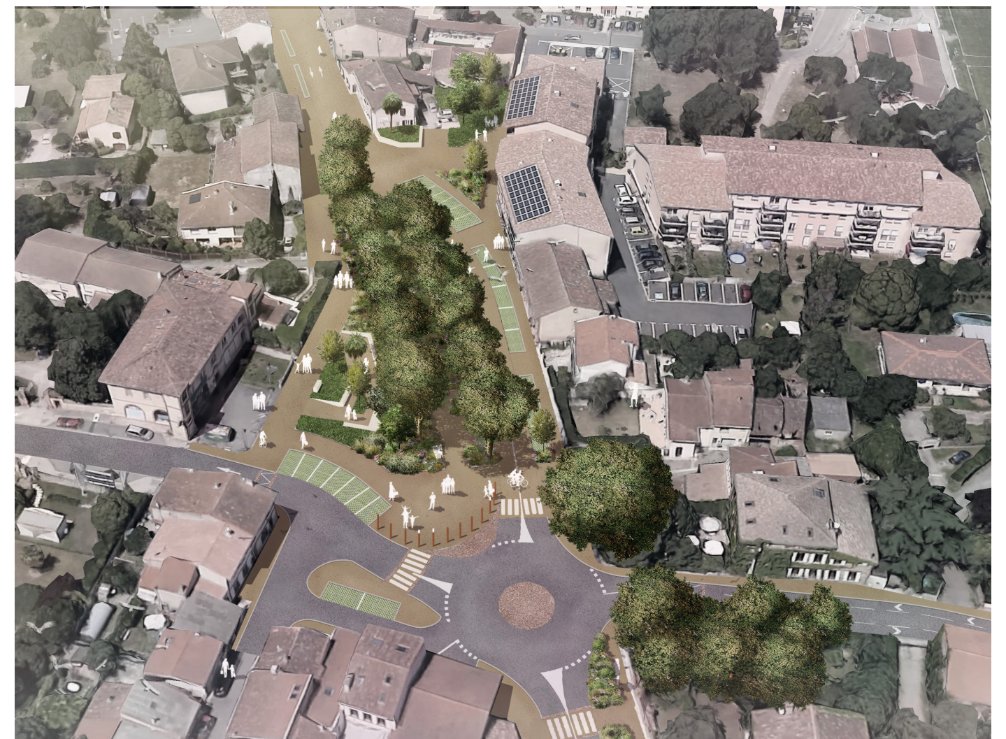
Atelier d'Aménagement et d'urbanisme (2AU)