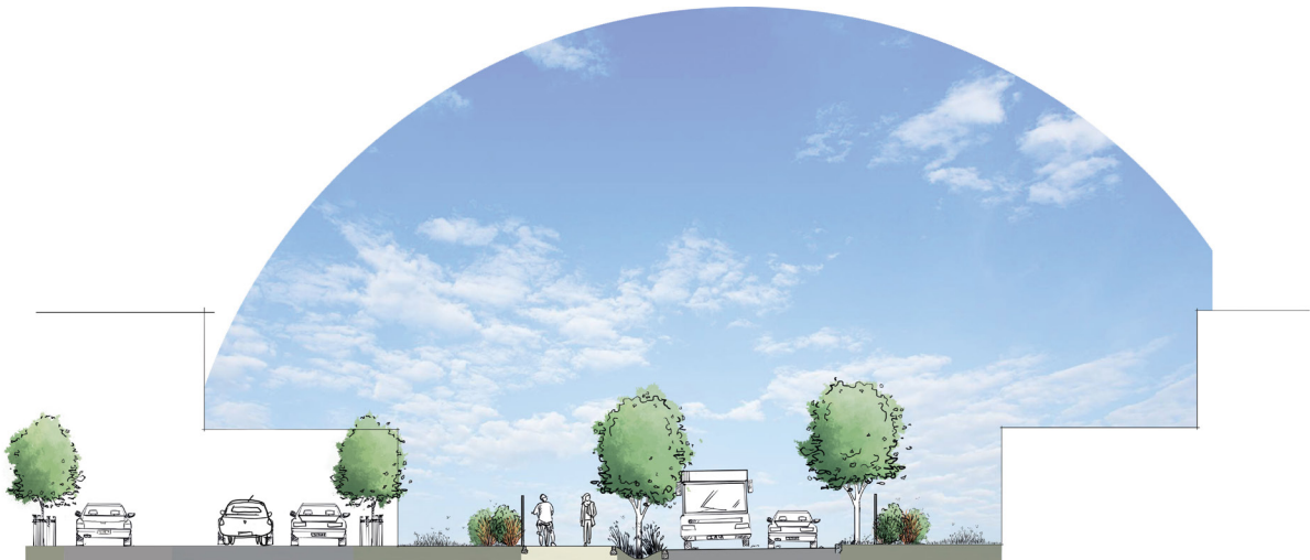
Coupe de principe de la voirie centrale et des accès aux lots