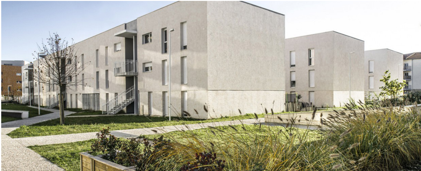
Atelier d’Aménagement et d’urbanisme (2AU)